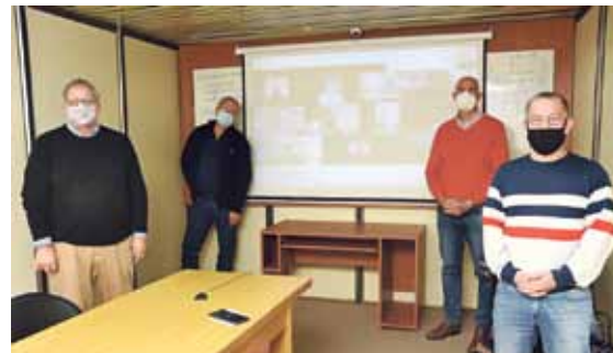
Consejo de representantes.

queda mucho por hacer, hubo cambios muy beneficiosos en la Caja. Uno de ellos fue la modernización de la gestión, a partir de nuevas herramientas de comunicación, que en sus palabras "marcó un antes y un después". Al respecto, explica: "generamos nuestra App, empezamos a utilizar las redes sociales y otras herramientas modernas para poder tener más llegada a los profesionales; y, a la vez, continuamos con la edición periódica de nuestra revista institucional disponible en la web y además con una tirada reducida en papel para los afiliados jubilados".