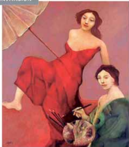
Homenaje a la pintura